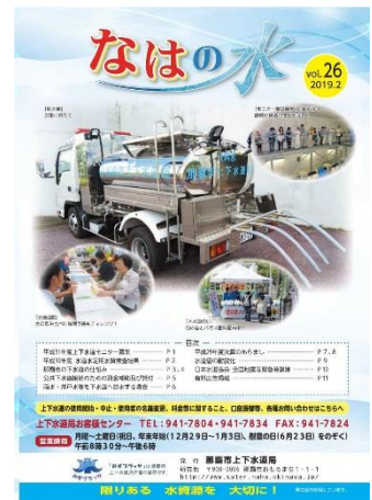
上下水道局広報誌 「なはの水」

問11 水道・下水道に関する広報を充実させる手段として有効だと思うものはどれですか。(〇はいくつでも)