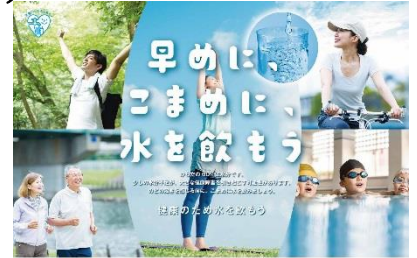
「健康のため水を飲もう推進委員会」ポスターより

問2 問1で「2」～「5」とお答えになった方におうかがいします。水道水を「そのまま飲まない」、または、「飲まない」理由をお聞かせください。(〇はいくつでも)