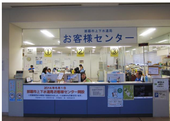
(那覇市上下水道局 お客様センター)

【その他、水道・下水道事業に対するご意見やご提案がありましたら、ご自由にお書きください。】